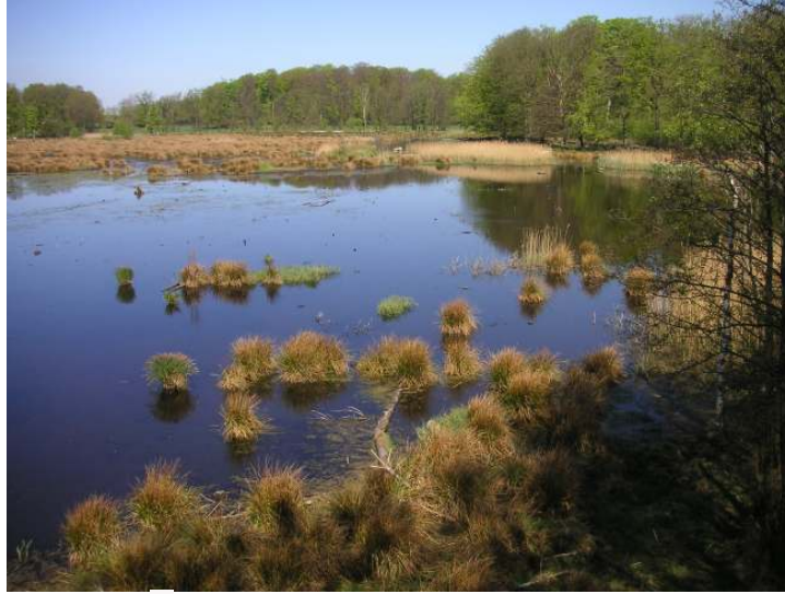
Bulls måse.