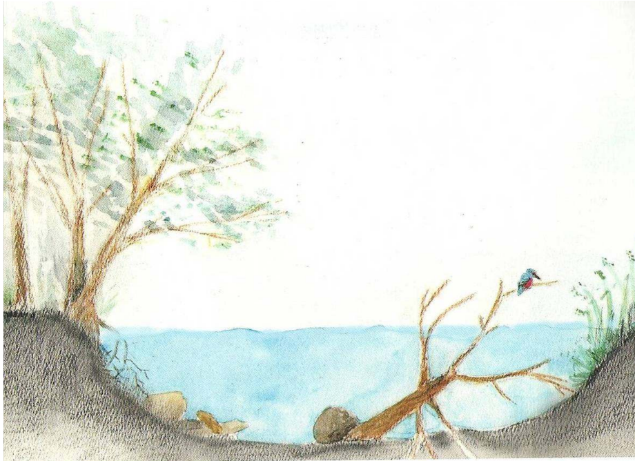
© Birgitta Bengtsson, bild ur Åmansboken, Saxån-Braåns Vattenvårdskommitté