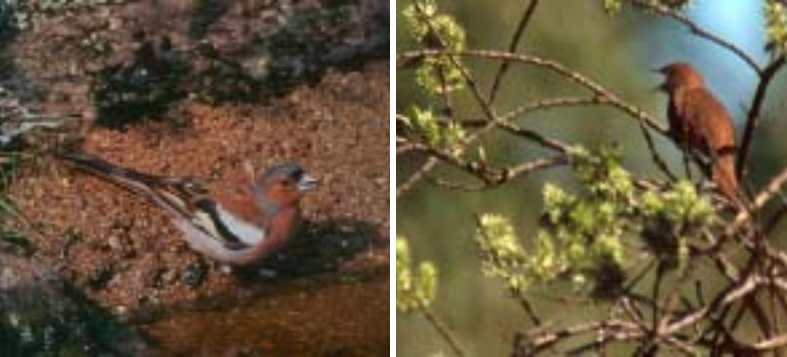
I Borgen är det många näbbar som ingår i den stora fågelkören. Bofink och näktergal (ovan) och järnsparv och lövsångare nedan.