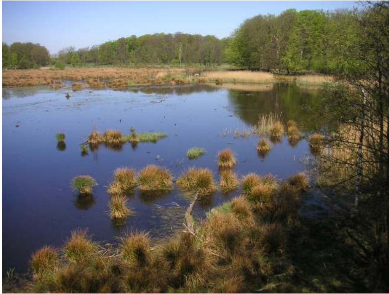
Bulls måse.