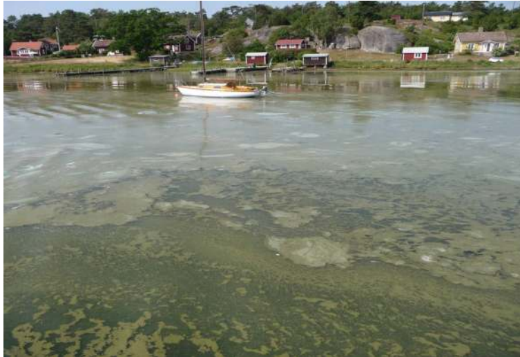
Blekinge skärgård.