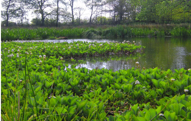
Bulls måse.

4. Varför gör man nya våtmarker? Vad stämmer bäst?